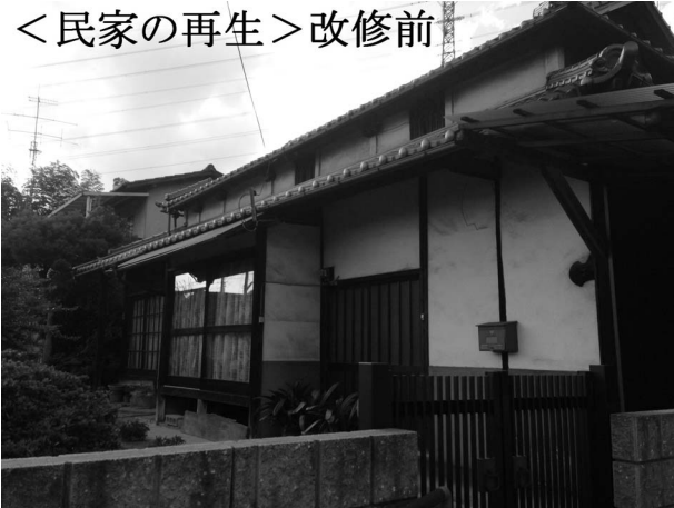
＜民家の再生＞改修前